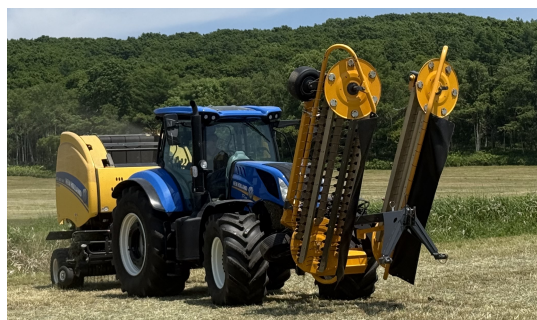
フロント装着時の移動状態