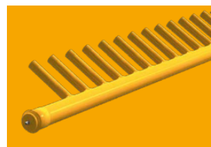
調整可能なカウンターバー

コンディショニングローターが牧草をカウンターバーに打ち付け、自重で落下するため風通しの良い状態に保たれます