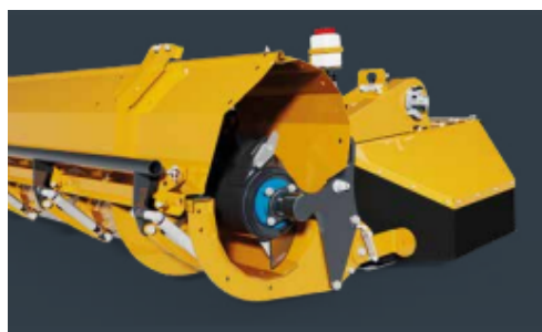
長い牧草の絡みつきを防止するオーガーカッター