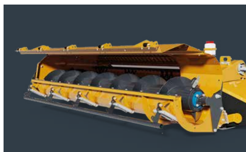
詰まりが発生した時にハッチが開きます